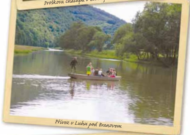
Přívoz v Luhu pod Branovem