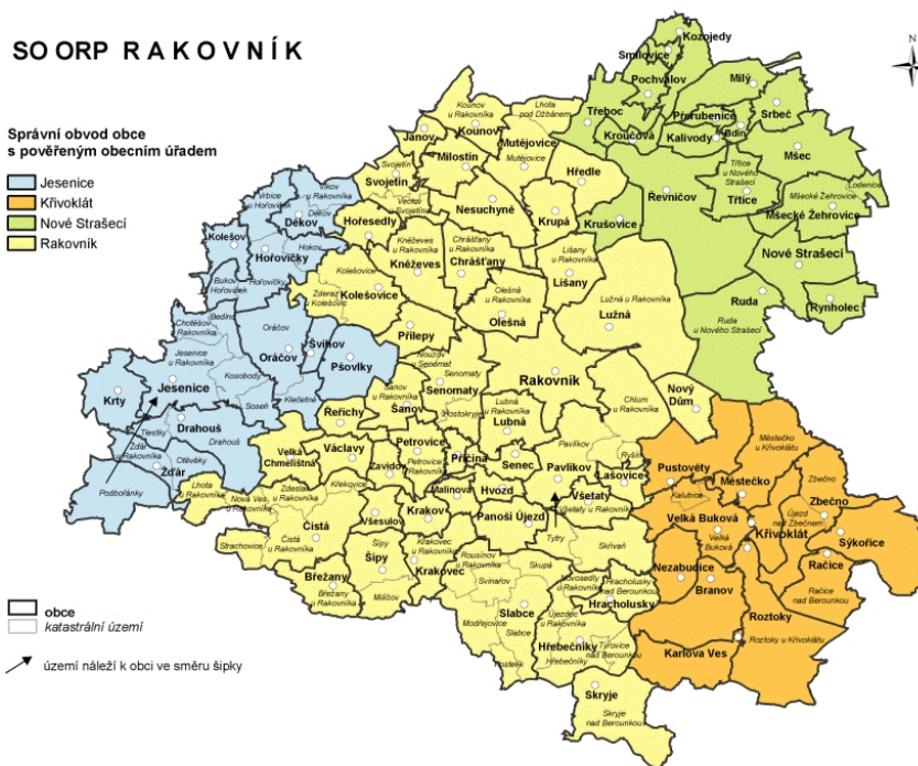
Obrázek 2 Územně správní členění území SCLLD MAS Rakovnicko ( www.czso.cz )