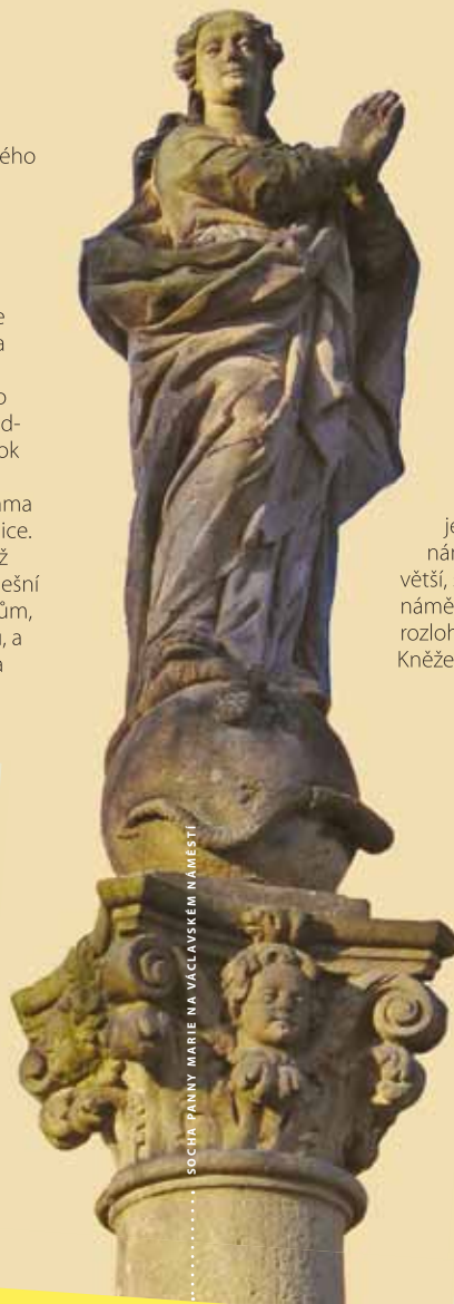
SOCHA PANNY MARIE NA VÁCLAVSKÉM NÁMĚSTÍ

Věšteckou mocí nadaná Libuše, dcera bájného knížete Kroka, stála nejen u zrodu matičky Prahy, ale také chmelařské Kněževsi. Pokud tedy věříte pověstem. Vypráví se, že když vděčný Krokův lid vystavěl svému knížeti roku 675 dřevěný hrad Krokovec (prý stál na místě dnešního hradu Krakovce), sešli se jednoho dne přední muži kmene Čechů na Krokovci, aby s knížetem a Libuší rokovali, jak na severu zabránit vpádu nepřátelského kmene. Libuše navrhla vybudovat na příhodných místech opevněné osady, které by útok nepřátel odrazily. Poté vyšla v čele zástupu Čechů z Krokovce k půlnoční straně, aby sama určila nejvhodnější místo pro hrazené vesnice. Průvod vedla bez zastávky několik hodin, až znenadání zastavila tam, kde se nachází dnešní Kněževs. Jak bylo zvykem, obětovala bohům, aby získala jejich přízeň pro budoucí osadu, a nato poručila kopáčům, aby ji následovali a