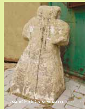
„SMÍRČÍ“ KŘÍZ V SENOMÁTECH .....