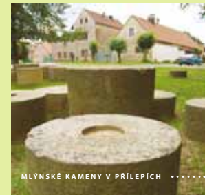
MLÝNSKÉ KAMENY V PŘÍLEPECH .....

Průvodce tematickým výletem „Čas přišel, česat chmel“ získáte zdarma na www.Rakovnicko.info nebo v informačních centrech.