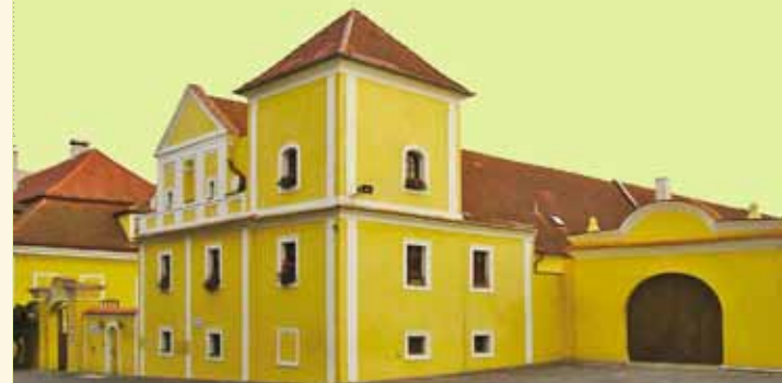
ZÁMEK V KOLEŠOVICÍCH (NEPŘÍSTUPNÝ) .....