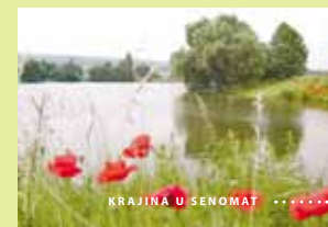
KRAJINA U SENOMÁT .....