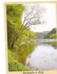
Berounka u Skryj