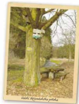
Údolí skřivaňského potoka