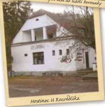
Hostinec U Rozvědčicka