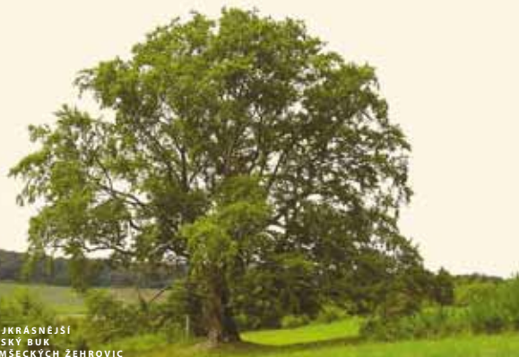
NEJKRÁSNEJŠÍ ČESKÝ BUK U MŠECKÝCH ŽEHROVIC

Vrchovina Džbán na rozhraní středních a severních Čech, vyhlášená roku 1994 pro svůj výjimečný a zachovalý krajinný a přírodní ráz přírodním parkem, je eldorádem milovníků záhad a tajemství - právě tady se totiž nachází proslulé kamenné řady u Kounova, pravěká stavba zvaná „nejzáhadnější místo Česka“.