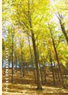
YPÍKÝ DŽBÁNSKÝ LES