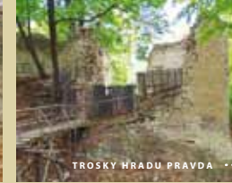
TROSKY HRADU PRAVDA