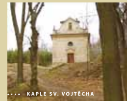
KAPLE SV. VOJTĚCHA