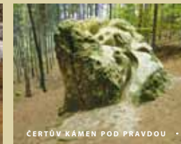
ČERTŮV KÁMEN POD PRAVDOU