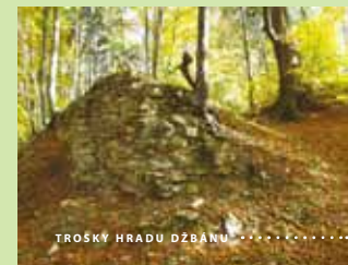
TROSKY HRADU DŽBÁNU

Průvodce tématickým výletem „Džbán pověstí a tajemství“ získáte zdarma na www.Rakovnicko.info a v informačních centrech.