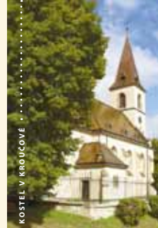
KOSTEL V KROUČOVĚ