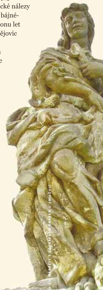
SOCHA SV. MARCÉTY S POKOŘENÍM DRAKEM U SMILOVIC

Na Džbáně se fantazie točí na plné obrátky a cesty tímto krajem, jemuž dávají nezaměnitelný vzhled rozsáhlé, zvláště bukové lesy, rychle se střídající hluboká údolí, stolové vrchy a opukové srázy (ten největší je dlouhý dva kilometry a má výšku asi čtyřicet metrů), promíšené s geometricky pravidelnými lány chmelnic, červenou hlínou polí a vesnicemi s unikátní lidovou architekturou domů, zděných z bílé opuky a zdobených detaily z rezných cihel, nedají