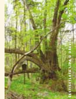
ŠESTISETLETÁ LIPA U DŘEVÍČ