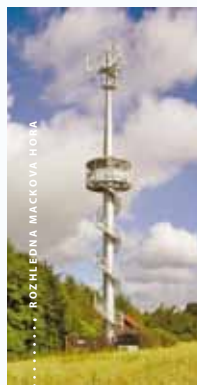
ROZHLEDNA MACKOVA HOŘA

květen-červen: so-ne 9-17, červenec-srpen: po-ne 9-17, září: so-ne 9-17, polední přestávka: 12-13