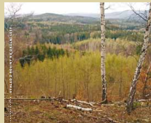
VÝHLED Z ROVINY NA OKOLNÍ LĚSY

Co by kamenem dohodil je z řad k několika dalším oblíbeným výletním cílům – poutnímu kostelíku sv. Vojtěcha, na hrady Pravdu a Džbán, Čertovým kamenům pod Pravdou a u Mutějovic, zaniklé vsi Staré Netluky nebo k augustiniánskému klášteru v Dolním Ročově, vrcholné stavbě českého baroka od Kiliána Ignáce Diezenhofera.