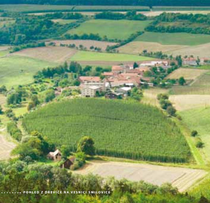
..... POHLED Z DŘEVÍČE NA VESNÍCI SMIŘOVICE