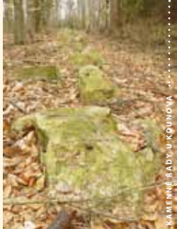
KAMENNÉ ŘADY U KOUNOVA