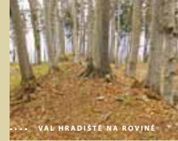
VAL HRADISTĚ NA ROVINĚ

PRŮVODCE OBLASTI KAMENNÝCH ŘAD U KOUNOVA ZISKÁTE ZDARMA NA WWW.RAKOVNICKO.INFO A V INFORMAČNÍCH CENTRECH.